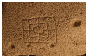
Echiquier. Musée du Chablais.

De même, un échiquier romain a été trouvé lors des fouilles de la maison Gilland (actuellement Les Hermaïs).