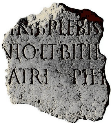
Inscriptions latines de Haute-Savoie. Edition Musée Château d'Annecy

Citons entre autres, en 1863, la mise au jour d'un fragment d'une plaque d'un beau calcaire blanc, portant une inscription rédigée probablement en l'an 136 de l'ère chrétienne. Elle provenait du tombeau élevé à un sénateur anonyme, vraisemblablement propriétaire à Concise, qui fut « tribun du peuple, questeur de la province du Pont et de Bithynie ».