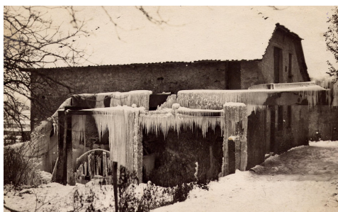
Moulin de la Mulaz Bregand

L'Oncion ainsi qu'un canal dérivé de la Dranse alimentaient le site en eau et permettaient l'irrigation des cultures. Sur leur cours, ont été installés quelques petits « artifices »**. Mermet Brisgand*** y avait par exemple construit un moulin et un battoir, au sujet desquels il eut des démêlés avec les syndics de Thonon.